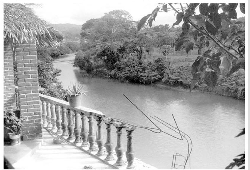
Paísaje del río Teapa, que tranquilidad. Está gráfica corresponde a hace unas semanas, antes de que la furia del agua llegará a tierras tabasqueñas proveniente del vecino estado.