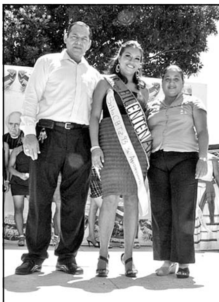
Autoridades del plantel colocaron la banda a la ganadora.