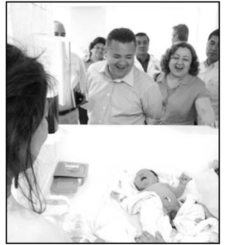
Visitaron el Hospital General de Comalcalco.

Con recursos del Fideicomiso para la Infraestructura de los Estados (FIES) se construyeron tramos aislados de terracería, drenaje, pavimento asfáltico y señalamiento horizontal en los caminos Reyes Hernández-Sargento López-La Lucha tramo del 0+000 al 7+600; Circuito El Guayo 2ª y 3ª sección, del kilómetro 0+000 al 9+800 y Lázaro Cárdenas 3ª sección Costera Arroyo Verde.