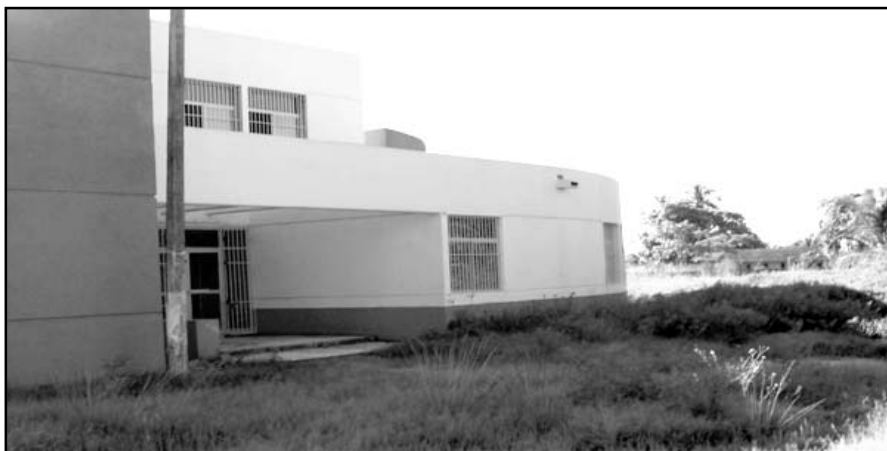
Está al 60 por ciento.

Cabe recordar que en el 2004 se puso la primera piedra de esta clínica y actualmente lleva un 60% de avance; solo falta una tercera y última etapa para terminarla.